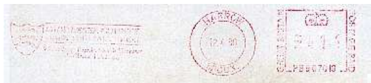
Middlesex County Rugby football Union 9 Broadway Parade North Harrow Middlesex HA2 7SZ Grande Bretagne