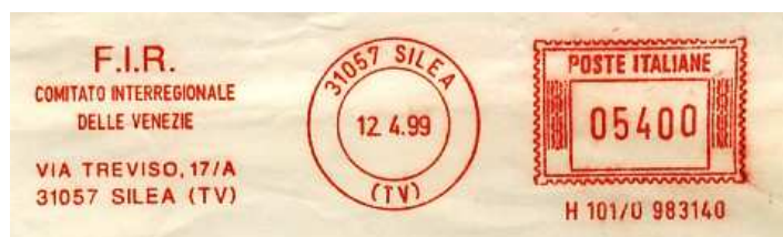
F.I.R. Comitato interregionale delle Venezie Via Treviso, 17/A 31057 SILEA (TV) Italie