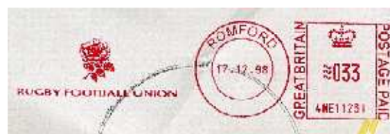
Rugby Football Union Le XV de la Rose