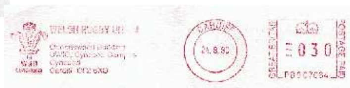
Welsh Rugby Union Queenswood Building UWIC Cynceed Campus Cynceed Cardiff CF2 6XD Grande Bretagne